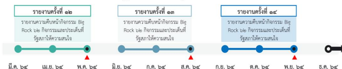
กรอบระยะเวลาการรายงานความคืบหน้าฯ แผนการปฏิรูปประเทศ (ฉบับปรับปรุง)

๒.๒ ในฐานะหน่วยงานผู้รับผิดชอบหลัก ให้รายงานความก้าวหน้าของเป้าหมายย่อย (MS) เมื่อสิ้นสุดระยะเวลาในการรายงานความก้าวหน้าของโครงการ/การดำเนินงานตามข้อ ๒.๑ ขอให้หน่วยงานผู้รับผิดชอบหลักประมวลผลข้อมูลความก้าวหน้าในการดำเนินโครงการ/การดำเนินงานภายใต้เป้าหมายย่อย (MS) ของกิจกรรม Big Rock ที่รับผิดชอบ เพื่อนำมาประเมินความสำเร็จของเป้าหมายย่อย (MS) นั้น ๆ โดยรายงานผ่านระบบ eMENSCR ด้วย username และ password ของกองแผนหรือกองที่ได้รับมอบหมายของหน่วยงานผู้รับผิดชอบหลักในการดำเนินการดังกล่าว ภายในเดือนถัดจากการรายงานความก้าวหน้าโครงการ/การดำเนินงานในข้อ ๒.๑ เพื่อให้ทันต่อการรายงานความคืบหน้าฯ ในแต่ละรอบการรายงานตามกรอบระยะเวลาการรายงานความคืบหน้าฯ แผนการปฏิรูปประเทศ (ฉบับปรับปรุง) เพื่อที่สำนักงานฯ จะได้ประมวลข้อมูลและจัดทำรายงานความคืบหน้าฯ เสนอต่อคณะรัฐมนตรีและรายงานรัฐสภาทราบต่อไป โดยสามารถดาวน์โหลดคู่มือในการใช้งานระบบ eMENSCR ได้ที่ http://nscr.nesdc.go.th/ระบบ-emenscr/