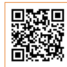
QR Code สำหรับนำเข้า worksheet ๑

๑.๓ เมื่อดำเนินการแล้วเสร็จให้อัพโหลดไฟล์ worksheet ๑ ในรูปแบบไฟล์เอกสาร (Excel) โดยใช้ชื่อไฟล์ “WS1 รหัสเป้าหมายแผนแม่บทย่อย (XXXXX) ตัวย่อชื่อหน่วยงาน” อาทิ “WS1 170101 สศช.” (อัปโหลด ๑ ไฟล์ต่อ ๑ เป้าหมายแผนแม่บทย่อย) ผ่านทาง Google Forms ( https://forms.gle/eS8amwuN7VBBnynN7 ) หรือ QR Code สำหรับนำเข้า worksheet ๑ ภายในวันที่ ๒๕ มิถุนายน ๒๕๖๔ เพื่อสำนักงานฯ จะได้ดำเนินการสรุปผลการทบทวนหน่วยงานที่เกี่ยวข้องกับเป้าหมายแผนแม่บทย่อย และเผยแพร่ผ่านทาง http://nscr.nesdc.go.th/project2566/ หรือ QR Code ที่แนบท้ายมาพร้อมนี้ ภายในวันที่ ๓๐ มิถุนายน ๒๕๖๔ ต่อไป