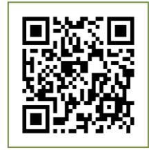
QR Code สำหรับนำเข้า worksheet ๒

๒. การนำเข้าการทบทวนห่วงโซ่คุณค่าฯ เมื่อดำเนินการแล้วเสร็จให้อัพโหลดไฟล์ worksheet ๒ ในรูปแบบไฟล์เอกสาร (Excel) โดยใช้ชื่อไฟล์ “WS2 รหัสเป้าหมายแผนแม่บทย่อย (XXXXX) ด้วยชื่อหน่วยงาน” อาทิ “WS2 170101 สคช.” (อัฟโหลด ๑ ไฟล์ต่อ ๑ เป้าหมาย แผนแม่บทย่อย) ผ่านทาง Google Forms ( https://forms.gle/cBtAtyHLSze4dzQr9 ) หรือ QR Code สำหรับนำเข้า worksheet ๒ ภายในวันที่ ๑๒ กรกฎาคม ๒๕๖๔ เพื่อสำนักงานฯ จะได้ดำเนินการประมวลผลและจัดทำข้อมูลห่วงโซ่คุณค่าของประเทศไทย ตามเป้าหมายแผนแม่บทย่อย ๑๔๐ เป้าหมาย (ฉบับปรับปรุง) เพื่อใช้เป็นเอกสาร ประกอบการจัดทำโครงการสำคัญประจำปี ๒๕๖๖ ของหน่วยงาน และเผยแพร่ผ่านทาง http://nscr.nesdc.go.th/project2566/ หรือ QR Code ที่แนบท้ายมาพร้อมนี้ ภายในวันที่ ๒๑ กรกฎาคม ๒๕๖๔ ต่อไป