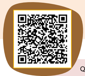
QR Code สำหรับการนำเข้าการทบทวนหน่วยงานที่เกี่ยวข้องฯ (Worksheet 1)