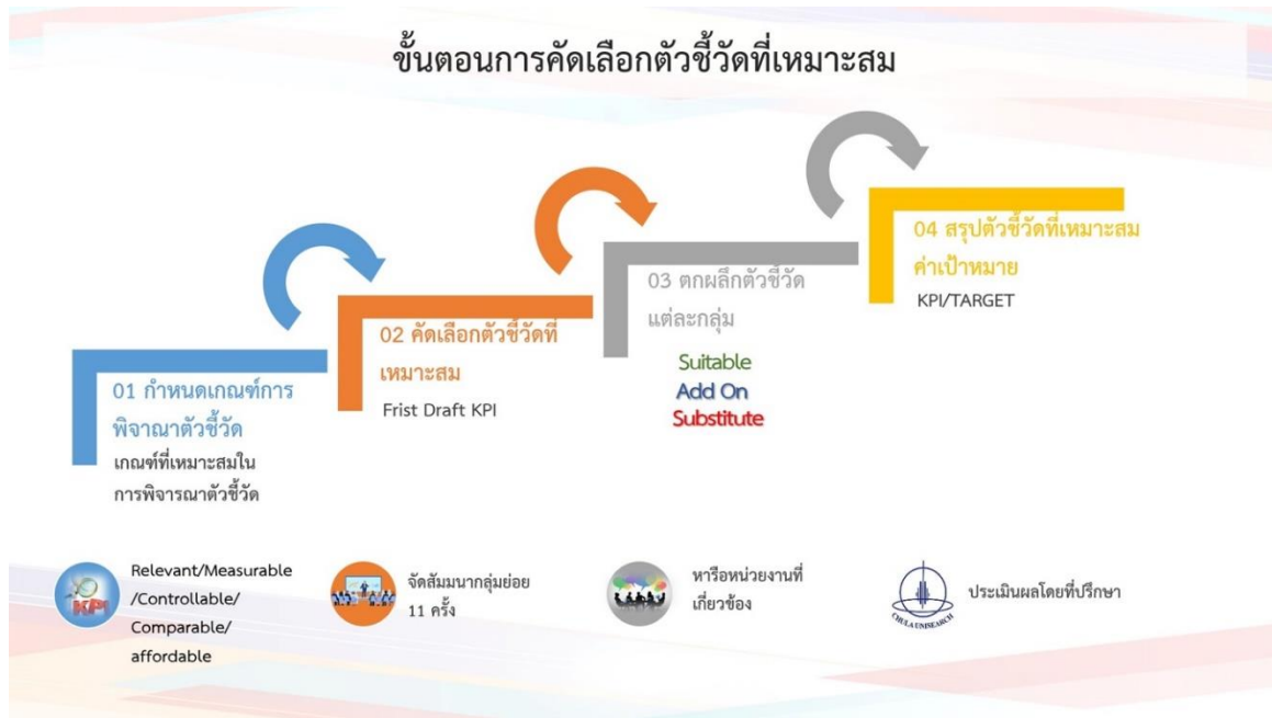
รูปที่ 2 ขั้นตอนการคัดเลือกตัวชี้วัดที่เหมาะสม