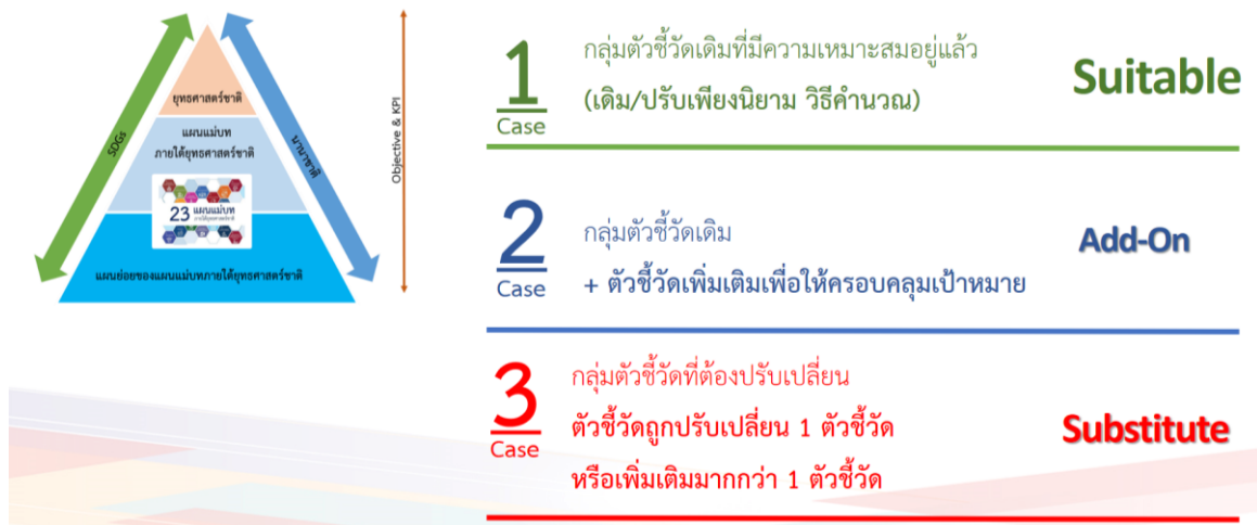
รูปที่ 3 สรุปกลุ่มตัวชี้วัดที่ได้จากการวิเคราะห์ช่องว่างจากการถ่ายทอดตัวชี้วัด

จากการประชุมกลุ่มย่อยและเข้าพบหน่วยงานที่เกี่ยวข้อง ที่ปรึกษาได้ทำการสรุปผลการวิเคราะห์ความเหมาะสมตัวชี้วัดและสถานภาพข้อมูลประกอบการพัฒนาตัวชี้วัดแผนแม่บทฯ ประเด็นที่ 1 ความมั่นคงตามหลักวิชาการโดยอาศัยเกณฑ์การพิจารณาประกอบกับผลคะแนนจากผู้เชี่ยวชาญที่ได้เข้าประชุมกลุ่มย่อย และการหารือกับหน่วยงานที่เกี่ยวข้องเพื่อร่วมสรุปความเหมาะสมของตัวชี้วัดในแต่ละเป้าหมาย อีกทั้งที่ปรึกษา ยังทำการตรวจสอบสถานภาพข้อมูลประกอบการพัฒนาตัวชี้วัด โดยการสืบค้นจาก Website และเข้าหารือกับหน่วยงานที่เกี่ยวข้องกับชุดข้อมูลเพื่อตรวจสอบสถานะข้อมูลภายใต้ตัวชี้วัดนั้น ๆ ซึ่งผลลัพธ์ที่ได้จะทำให้ทราบถึงความพร้อมของข้อมูลของแต่ละตัวชี้วัด ผลการวิเคราะห์ความเหมาะสมตัวชี้วัด ประเด็นที่ 1 ความมั่นคงดังแสดงในรูปที่ 4 และตารางที่ 4