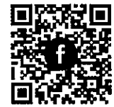
การประกวดภาพถ่าย การขับเคลื่อน ๑๓ หมวดหมู่

นอกจากนี้ ในการสร้างความตระหนักรู้และส่งเสริมการมีส่วนร่วมของประชาชนและภาคีการพัฒนาในการขับเคลื่อนแผนพัฒนาฯ ฉบับที่ ๑๓ สำนักงานฯ ได้จัดการประกวดผลงานภาพถ่ายของประชาชนทั่วไป ภายใต้หัวข้อ “จุดประกายการขับเคลื่อน ๑๓ หมวดหมู่นิเวศน์ท้องถิ่นและตำบล” ซึ่งมีกำหนดเปิดรับภาพถ่ายตั้งแต่วันที่ ๘ มีนาคม - ๘ พฤษภาคม ๒๕๖๖ และประกาศผลในวันที่ ๓๐ พฤษภาคม ๒๕๖๖ ในขณะเดียวกัน สำนักงานฯ อยู่ระหว่างการพัฒนาระบบแสดงผลการขับเคลื่อนแผนพัฒนาฯ ฉบับที่ ๑๓ ในระดับพื้นที่ (Showcase) ที่เชื่อมโยงกับฐานข้อมูลเปิดของภาครัฐ เพื่อสนับสนุนการติดตาม และประเมินผลการดำเนินงานตามยุทธศาสตร์ชาติ (Open-D) เพื่อเป็นช่องทางในการเผยแพร่ข้อมูลการดำเนินงานในระดับพื้นที่ที่สอดคล้องกับแผนพัฒนาฯ ฉบับที่ ๑๓ ตลอดจนบูรณาการกับข้อมูลการดำเนินงานอื่น ๆ ในระดับพื้นที่ อาทิ การขับเคลื่อนเป้าหมายการพัฒนาที่ยั่งยืน และการดำเนินงานของ ศูนย์อำนวยการขจัดความยากจนและการพัฒนาคนทุกช่วงวัยอย่างยั่งยืนตามหลักปรัชญาของเศรษฐกิจพอเพียง (ศจพ.) ในกรณีนี้ หน่วยงานต่าง ๆ สามารถร่วมประชาสัมพันธ์เชิญชวนบุคลากรและประชาชนทั่วไปให้ส่งผลงานภาพถ่ายเข้าประกวด รวมถึงร่วมนำเข้าสู่ข้อมูลของการดำเนินงานในระดับพื้นที่ที่สอดคล้องกับแผนพัฒนาฯ ฉบับที่ ๑๓ เพื่อเผยแพร่ในระบบ Showcase เมื่อการพัฒนาระบบแล้วเสร็จ