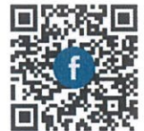
การประกวดภาพถ่าย การขับเคลื่อน ๑๓ หมวดหมาย

นอกจากนี้ ในการสร้างความตระหนักรู้และ ส่งเสริมการมีส่วนร่วมของประชาชนและภาคีการพัฒนาในการขับเคลื่อนแผนพัฒนาฯ ฉบับที่ ๑๓ สำนักงานฯ ได้จัดการประกวดผลงานภาพถ่ายของประชาชนทั่วไป ภายใต้หัวข้อ “จุดประกายการขับเคลื่อน ๑๓ หมวดหมายในระดับท้องถิ่นและตำบล” ซึ่งมีกำหนดเปิดรับภาพถ่ายตั้งแต่วันที่ ๘ มีนาคม - ๘ พฤษภาคม ๒๕๖๖ และประกาศ ผลในวันที่ ๓๐ พฤษภาคม ๒๕๖๖ ในขณะเดียวกัน สำนักงานฯ อยู่ระหว่างการพัฒนา ระบบแสดงผลการขับเคลื่อนแผนพัฒนาฯ ฉบับที่ ๑๓ ในระดับพื้นที่ (Showcase) ที่เชื่อมโยงกับฐานข้อมูลเปิดของภาครัฐ เพื่อสนับสนุนการติดตาม และประเมินผลการดำเนินงาน ตามยุทธศาสตร์ชาติ (Open-D) เพื่อเป็นช่องทางในการเผยแพร่ข้อมูลการดำเนินงานในระดับพื้นที่ ที่สอดคล้องกับแผนพัฒนาฯ ฉบับที่ ๑๓ ตลอดจนบูรณาการกับข้อมูลการดำเนินงานอื่น ๆ ในระดับพื้นที่