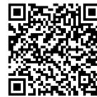
QR Code ๑ เป้าหมายแผนแม่บทย่อย (Y1) ที่เกี่ยวข้องกับ ศจพ. ๓๖ เป้าหมาย

เลขาธิการสภาพัฒนาการเศรษฐกิจและสังคมแห่งชาติ