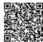
QR Code ๒ คู่มือและหลักเกณฑ์ การประเมินให้คะแนน โครงการฯ ประจำปี ๒๕๖๘

กองยุทธศาสตร์ชาติและการปฏิรูปประเทศ โทร. ๐ ๒๒๘๐ ๔๐๘๕ ต่อ ๖๒๒๑, ๖๒๒๓, ๖๒๒๘, ๖๒๕๐ โทรสาร ๐ ๒๖๒๘ ๒๘๕๘